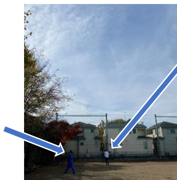
<外で仲良くバドミントン♪>